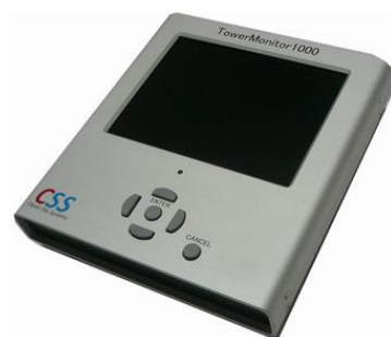
ネットワーク診断装置 TowerMonitor1000